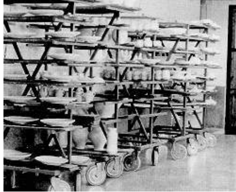
Fig. 6: Zócalos altos y suelos del mismo material fácilmente lavables. Los desniveles para el paso de carros, del mismo material.

Será necesario contar con suelos lisos y fácilmente lavables en distintas secciones de la cerámica (molienda, barnizado, decoración, ciertas zonas de paso) así como altos zócalos en las mismas. La limpieza y descontaminación de suelos y zócalos podría efectuarse mediante mangueros, contando con los correspondientes desagües y los adecuados desniveles en los suelos. Sin embargo este procedimiento de descontaminación adolece de inconvenientes en determinadas zonas y épocas del año. En estos casos la alternativa recomendable es la utilización de aparatos limpiadores en húmedo que se pasarán sobre los suelos, y que podrán ser manuales para los zócalos con la frecuencia que sea necesaria. (Fig. 6)