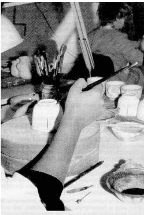
Fig. 4: Aplicación de pintura a pincel sobre la capa de barniz

Por otra parte, los roces sobre las piezas, las huellas de los dedos y otras circunstancias, hacen necesarios retoques y repasados de la capa de barniz depositado, inmediatamente antes de procederse al decorado. Los procedimientos para ejecutar estos repasados son muy variados, si bien en la mayor parte de los casos generan polvo con un cierto contenido en plomo.