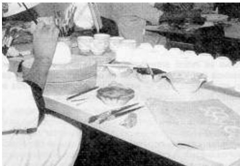
Fig. 3: Mesa de trabajo de decorado. Aparecen restos de repasados y polvo procedentes de la capa de barniz a decorar

contaminación detectados en estas tareas oscilan entre una y dos veces el valor de referencia.