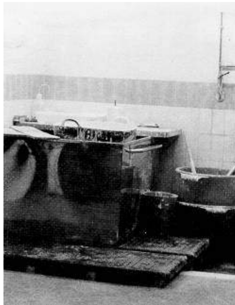
Fig. 2: Área para barnizado. La operación se efectúa sobre un depósito de acero inoxidable, que se encuentra sobre un suelo a menor nivel con lecho de agua. Paredes de azulejo con "cortina de agua". La zona sobre la que se dispone el trabajador, de goma negra para advertir posibles proyecciones

Si se realiza por inmersión, los trabajos en esta sección se efectuarán en zonas de la menor dimensión posible, sobre suelos inclinados y con paredes alicatadas. Se implantarán cortinas o vertidos de agua que arrastren las proyecciones y escurridos hacia un desagüe y un separador, de modo que se eluda la posibilidad de que puedan secarse los restos del barniz. (Fig. 2)